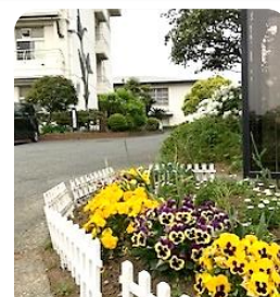
第1回 花壇ボランティア実施 ご協力ありがとうございました♪ (4月24日)