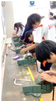
3年生 技術科 キーホルダー製作