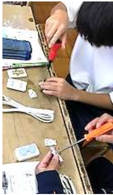
2年生 技術科 テーブルトップ製作