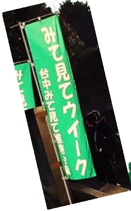
「みて見てウィーク」