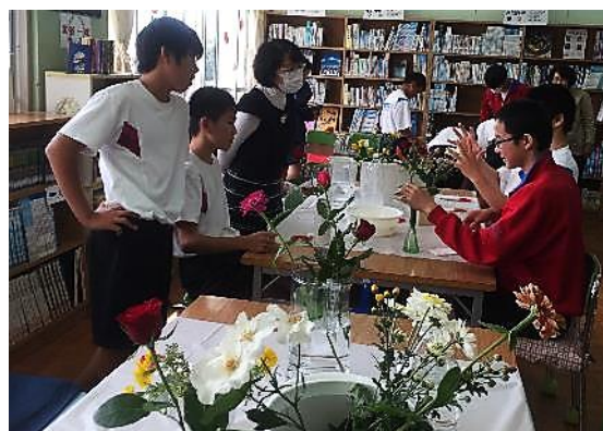
一輪挿し教室の様子